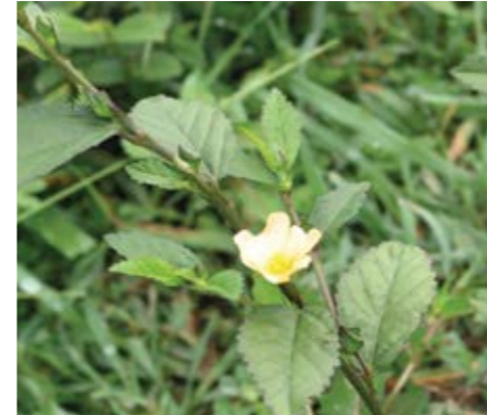
Escoba ( Sida acuta )