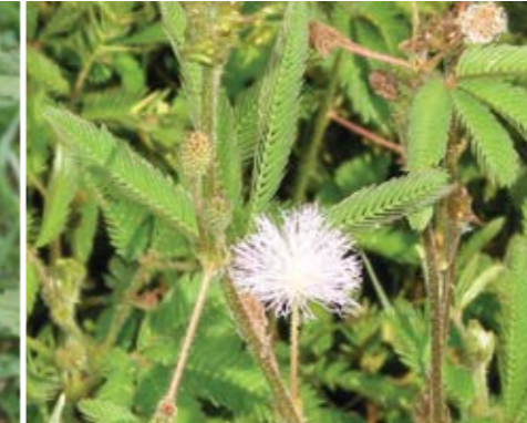
Dormidera ( Mimosa pudica )