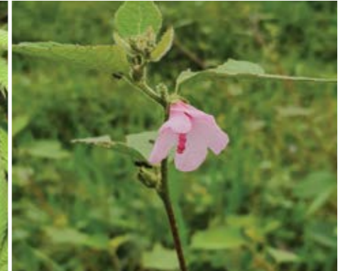
Malva ( Urena lobata )