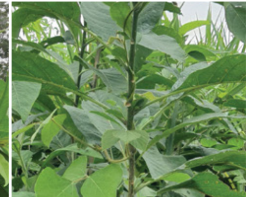
Cojojo ( Acnistus arborescens )