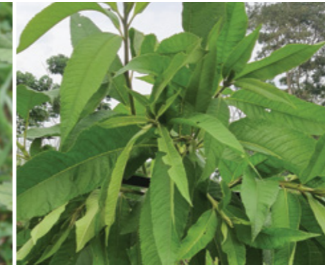
Chilca negra ( Baccharis latifolia )