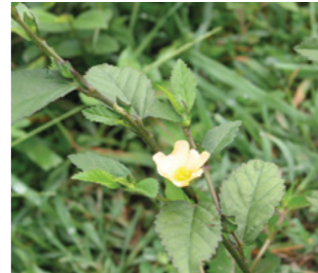
Escoba ( Sida acuta )